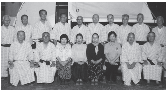
新発田商工高校3年B組同級会 大観荘せなみの湯 平成23年6月26日