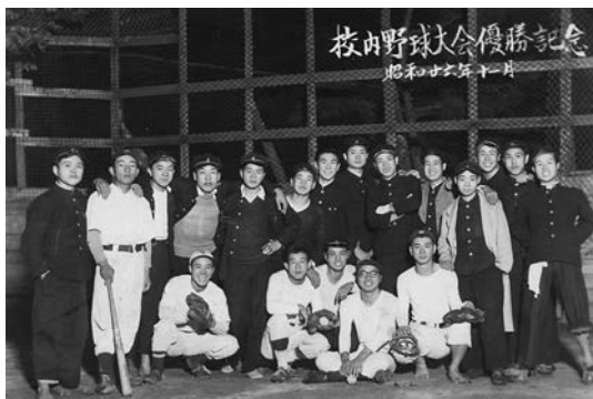
校内野球大会優勝記念 昭和26年10月

対芝農戦では逆に敗けた覚えはありません。他校とも練習試合もした記憶がありません。高校卒業後某運送会社に入社し職場は全国組織の会社で野球が盛んでした。30年40年時代は何処の職場も野球時代で多くの試合をしました。昭和58年商工高校分離で芝商野球部OB会が結成され初代会長に選出され学校長高橋