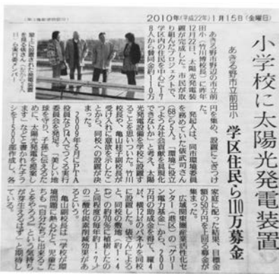
平成22年1月15日読売新聞朝刊・多摩版