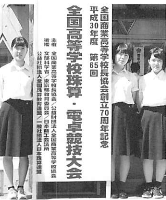
全国商業高等学校長協会創立70周年記念 平成30年度 第65回 全国高等学校珠算・電卓競技大会 主催 全国商業高等学校長協会 公益財団法人全国商業高等学校協会 副理 文部科学省

全国大会の会場は、これまで出場してきた大会会場とは違った独特な雰囲気が出ていました。広いフロアに五百人以上の選手が集い、競技をするのは初めての経験でしたが、緊張せず、普段通りに計算することができました。競技が終わって一番に感じたことは、努力は自信に変わるということです。良い結果を残している選手ほど自信を持って競技をしているように感じました。それと同時に、自分の努力不足を実感しました。それでも、私なりに三年間努力して部活を続けてきたことを自信に変え、競技に挑むことができたので満足しています。私をかこまで成長させてくれた先生や仲間感謝しています。