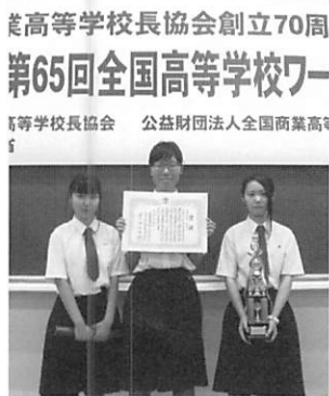
全国高等学校長協会創立70周年 第65回全国高等学校ワ ープロ競技会 公益財団法人全国商業高

私がかこまで成長できたのは優しい顧問の先生、心配して下さる先輩方、一生懸命な後輩達、応援して下さいました先生や友達・家族、三年間一緒に頑張ってきた二人のおかげです。今まで本当にありがとうございました。