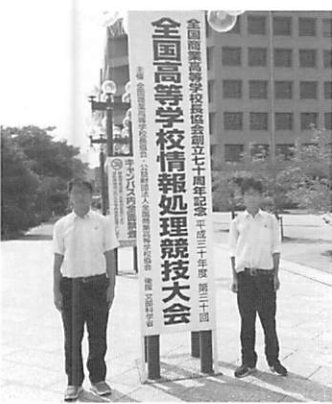
全国商業高等学校長協会創立70周年記念 平成30年度 第65回 全国高等学校情報処理競技大会 主催 全国商業高等学校長協会 公益財団法人全国商業高等学校協会 副理 文部科学省

しかし、全国大会出場という貴重な経験ができたことにとても満足しています。かこまで私を支えて下さった先生や先輩、後輩、家族の方々にも感謝しています。本当にありがとうございました。