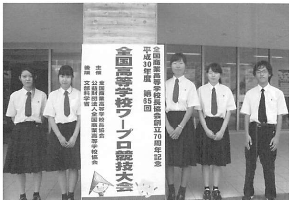
全国商業高等学校長協会創立70周年記念 平成30年度 第65回 全国高等学校ワープロ競技大会 主催 全国商業高等学校長協会 公益財団法人全国商業高等学校協会 副理 文部科学省