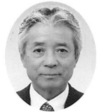
同窓会長 商工第20回卒