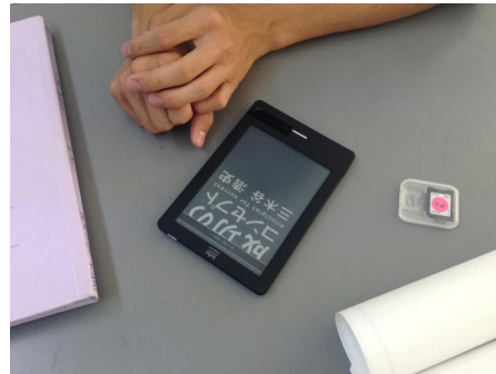
< K o b o >