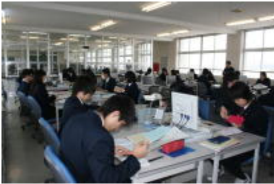
「総合実践」授業風景

商品企画・開発では、自分たちの考えたオリジナル商品を企業と連携して開発・販売をしています。独立行政法人工業所有権情報・研修館主催の「知的財産権に関する想像力・実践力・活用力開発事業」に参加し、アイデアを知的財産へと具体化していく過程、そして具体化された知的財産の出願する手続きなどを実践的に学んでいます。