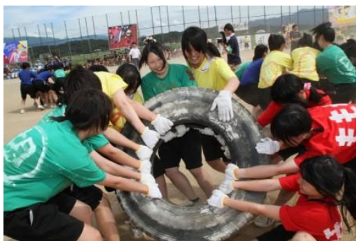
体育祭 (タイヤでポン)

生徒会執行部を中心に企画した学校行事を生徒一人一人が積極的に取り組み、盛り上げています。体育祭は、5軍に分かれ競い、特に応援合戦が最大の見せ場になります。文化祭は、模擬店やステージ発表が盛大に行われます。