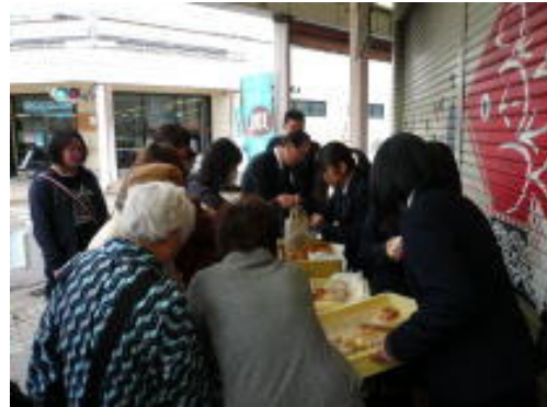
「販売実習」授業風景